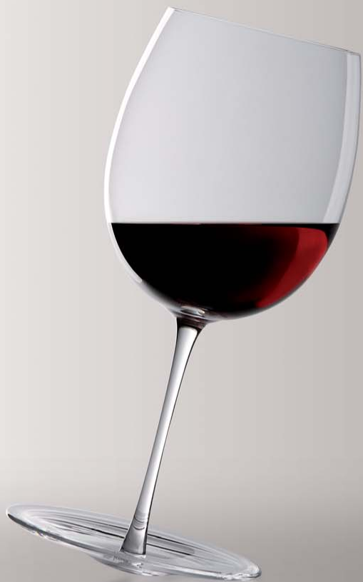
SWING - Collevilca Cristalleria - Gumdesign - www.collevilca.it

La trasformazione del piede consente una migliore decantazione del vino: quando il vino entra nel bicchiere comincia a oscillare e sarà sufficiente un dito per riproporre il movimento oscillatorio.